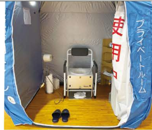
熱圧着で密封して汚物を処理できる非常用トイレ。介護用品としても使うことができるタイプです。

特に困難になったのはトイレでした。仮設トイレが設置されるのに通常3日かかると言われていますが、今回では5日かかった所もありました。大地震の後は、断水してなくてもトイレにそのまま用を足してはいけません。配管が壊れていることがあり、その場合はあつという間に汚物まみれになってしまいます。今回の震災でも多くの避難者で混乱したため、避難所のトイレは汚物まみれになりました。悪臭もひどいため、トイレを我慢してしまう人も続出しました。トイレを我慢するために水分を控えることは、脱水症状やエコノミー症候群を引き起こすリスクがあります。