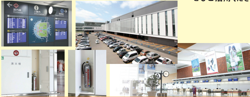
新千歳空港 国際線旅客ターミナルビル様

YP color fire extinguishers are set up at airport, shopping mall and many facilities.