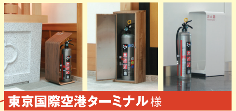
東京国際空港ターミナル様