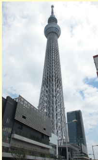
東京スカイツリータウン®様

Please utilize the information from our performance.