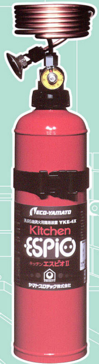
天ぷら油消火用簡易装置