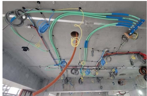
【パラソループ工法(左)とヘッダー工法(右)の比較】